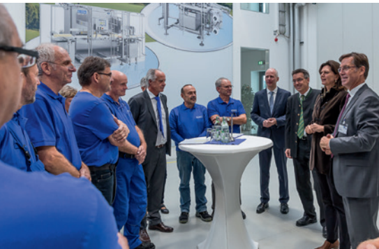
Ilse Aigner im Gespräch mit den langjährigen ALPMA-Mitarbeitern